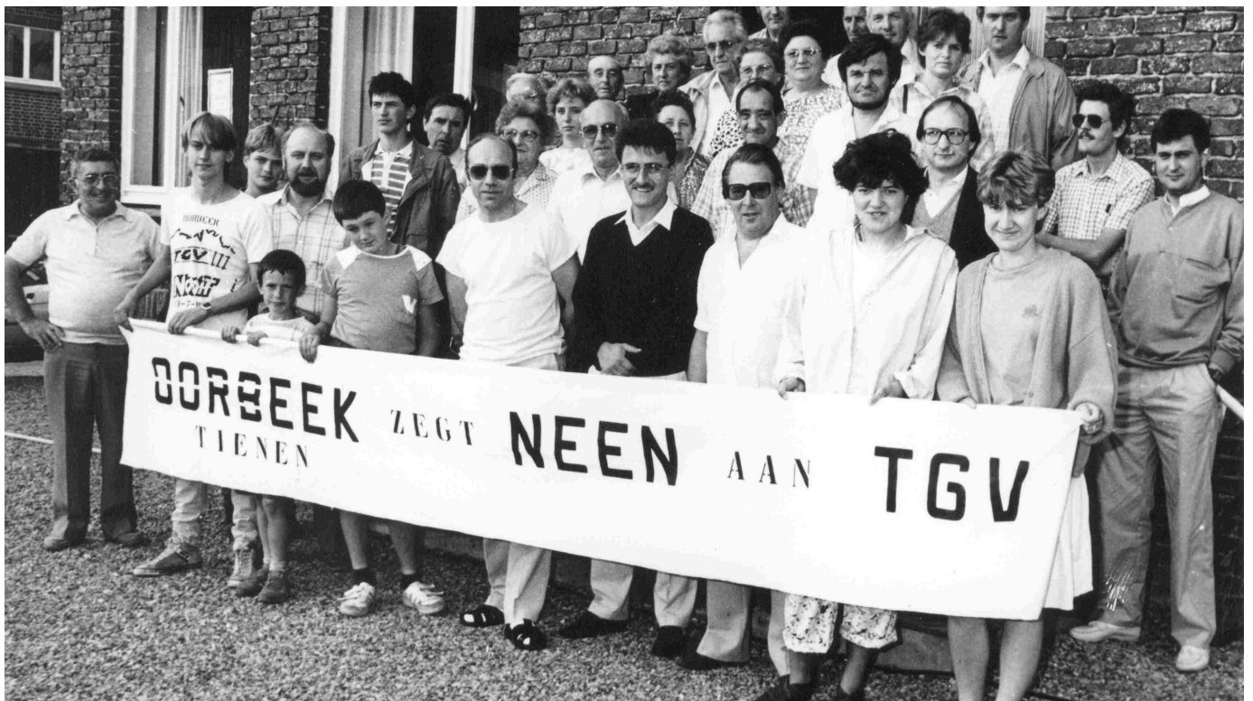
Het anti-TGV comité van Oorbeek