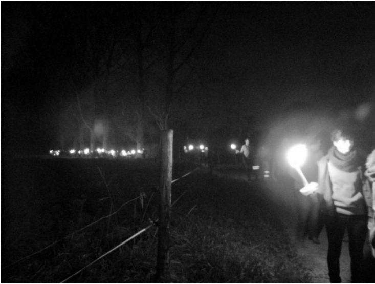
Fakkeltocht: 100 wandelaars