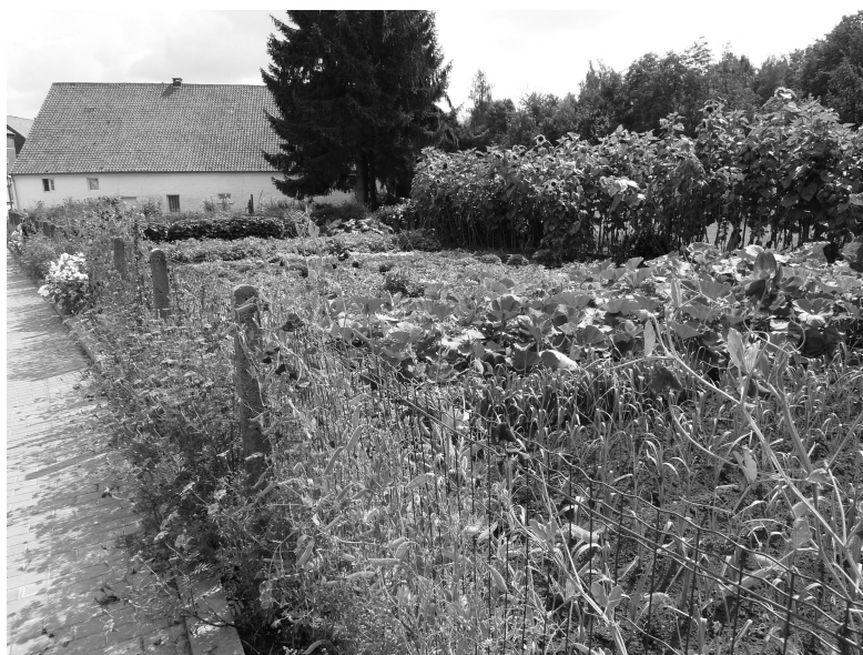
De prachtige moestuin van Camille Palfliet tijdens de zomer 2011